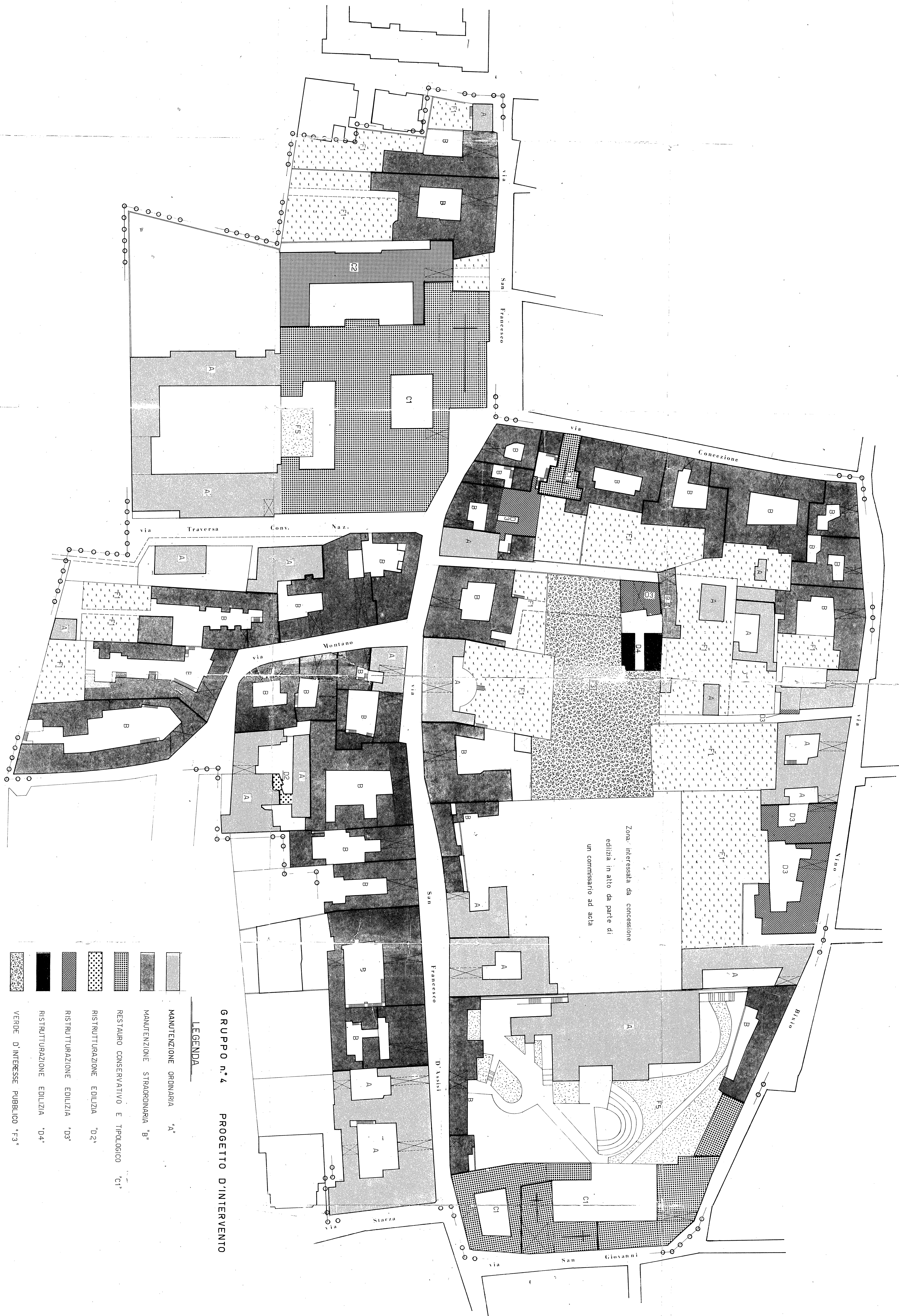
GRUPPO n. 4 PROGETTO D'INTERVENTO